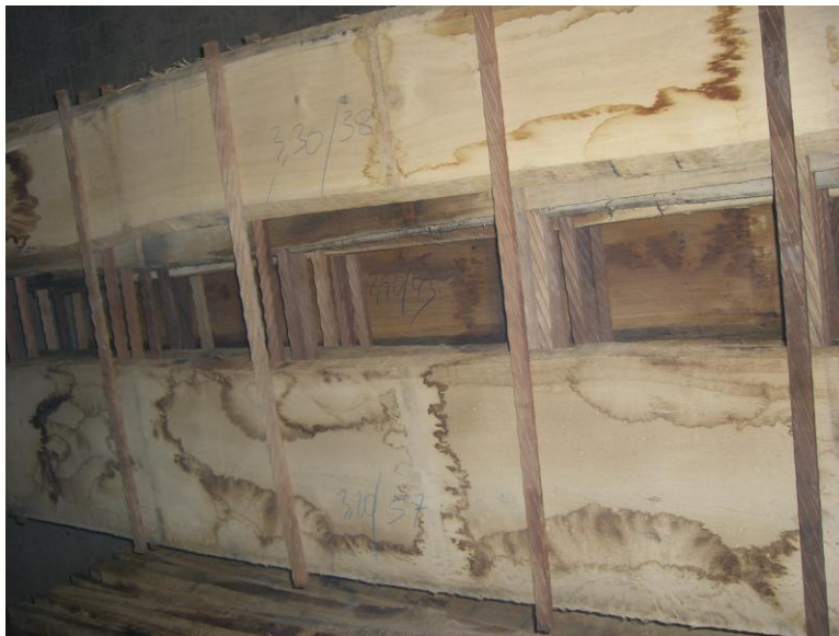
Eiche Schnittholz auch als blockliegende oder lose unbesäumte Ware in sämtlichen Qualitäten