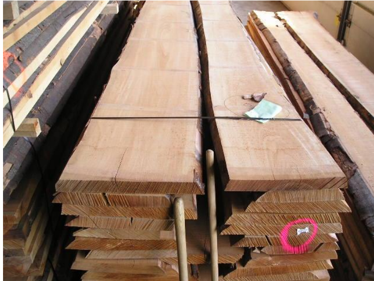
Buche Schnittholz in diversen Qualitäten und Dimensionen

Sägewerk Wagener GmbH - Seringhauser Strasse 4 - 59597 Erwitte-Schmerlecke